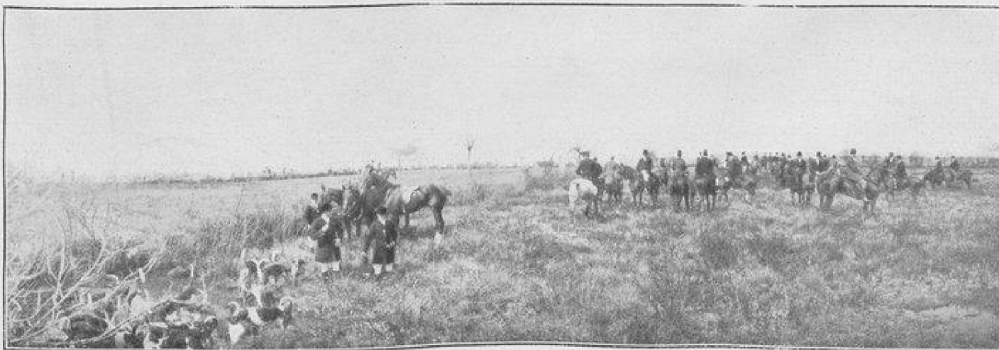
LES CHASSES DE PAU APRÈS LA PRISE DU RENARD