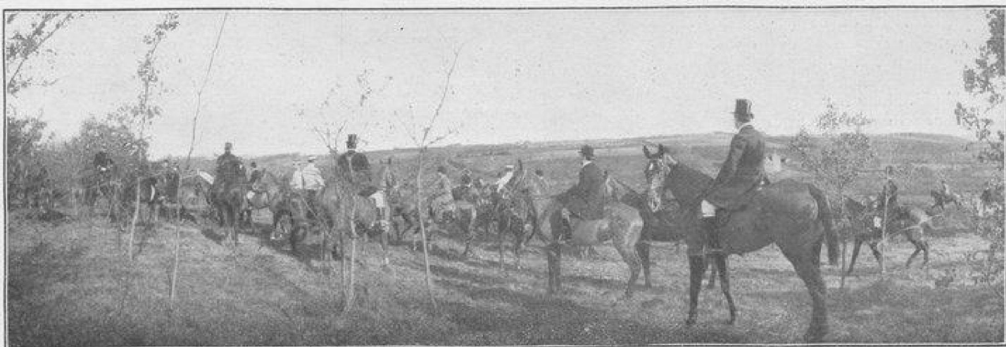
LES CHASSES DE PAU UN RENDEZ-VOUS DANS LA LANDE