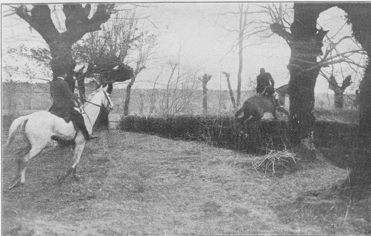
LES CHASSES DE PAU PENDANT LES DRAGS LES CAVALIERS DOIVENT FRANCHIR DE NOMBREUX OBSTACLES