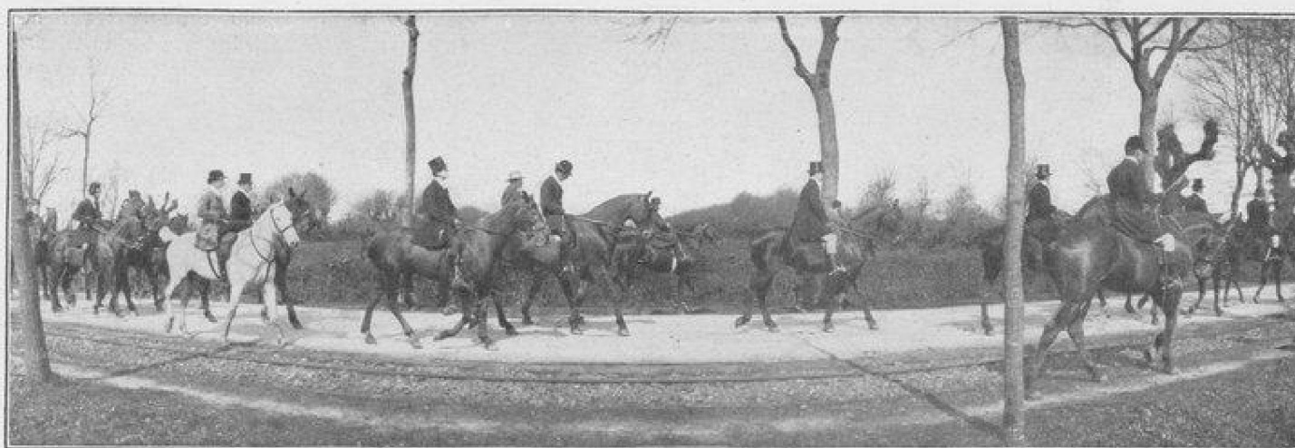
LES CHASSES DE PAU LES CHASSEURS QUITTENT LE CHENIL POUR SE RENDRE AU RENDEZ-VOUS