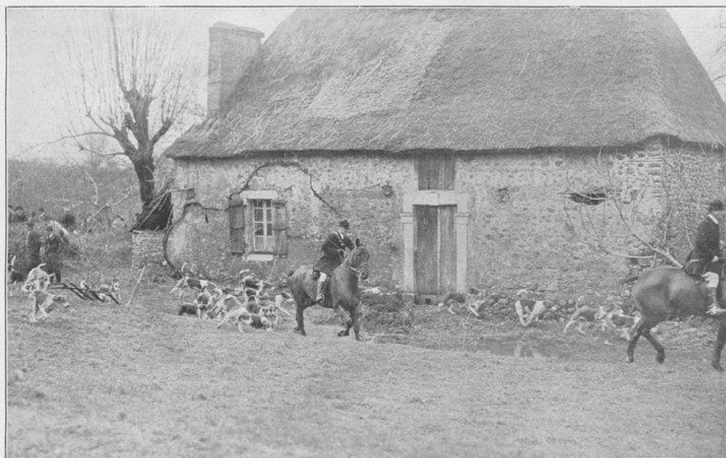
LES CHASSES DE PAU L'ATTAQUE